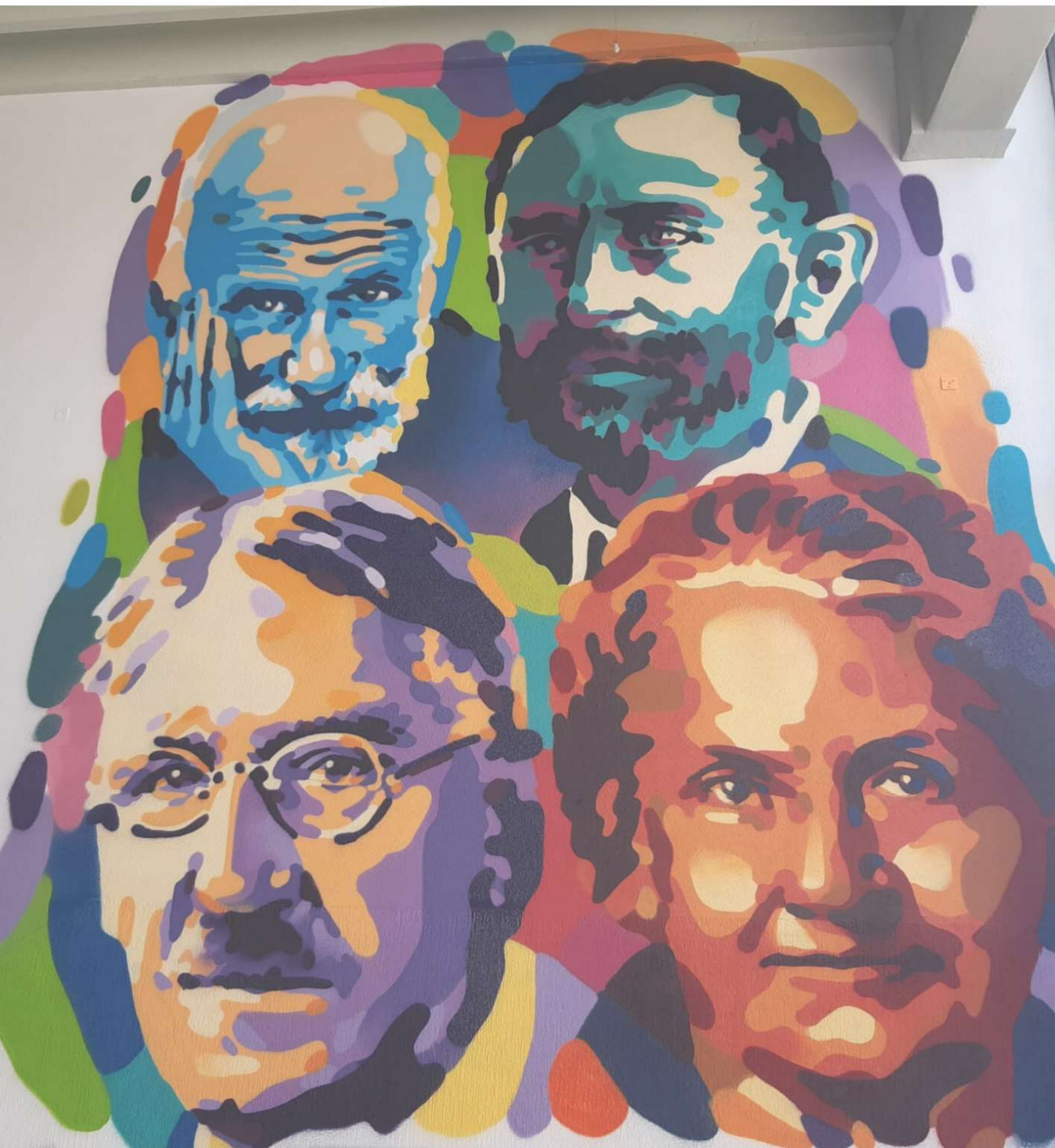
Graffiti titulado "Rostros de la Escuela Nueva" del autor Ramón Sendra en 2022.