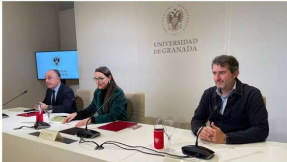
Firma del convenio entre la Universidad de Granada y CaixaBank

↳ La Universidad de Granada ocupa el puesto 12 del ranking Shanghai de Ciencias del Deporte 2024